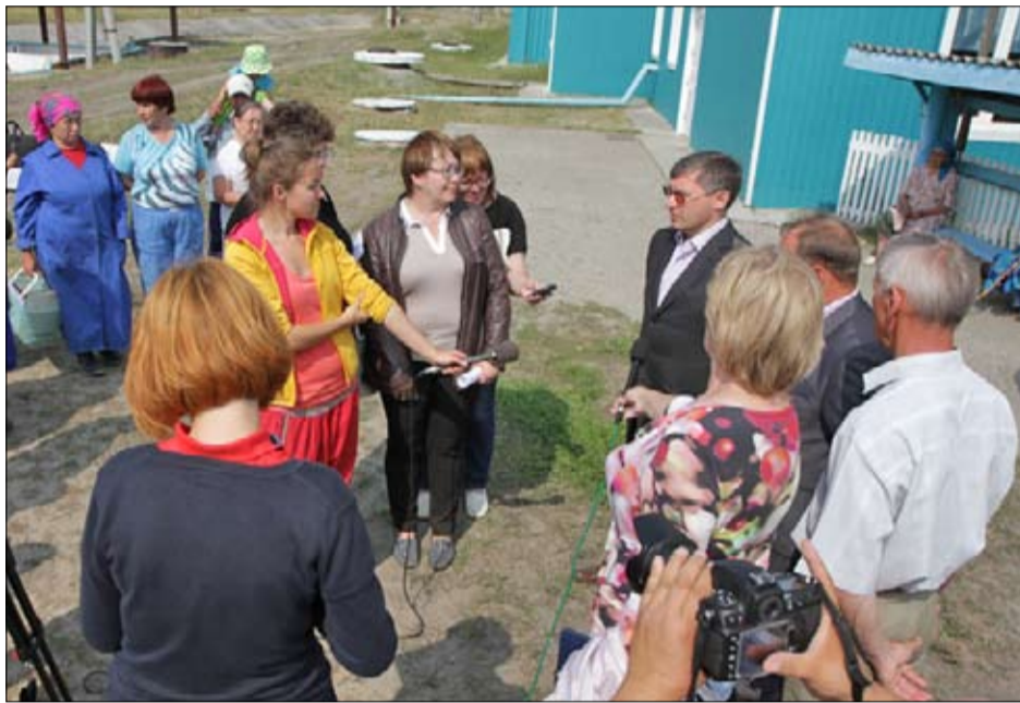
Встреча с журналистами и населением

Пелядь идёт на зарыбление озёр и коммерческую реализацию, - поясняет руководитель предприятия. - По этому направлению большая конкуренция, но спрос на ли-