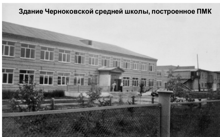
Здание Черноковской средней школы, построенное ПМК

ленческого аппарата, входили шесть строительных участков, три лесоучастка, автотранспортный цех с набором грузовых и специальной техники, объекты, обеспечивающие выполнение ее производственной программы.