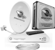
Комплект Триколор ТВ