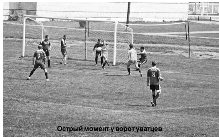
Острый момент у ворот уватцев