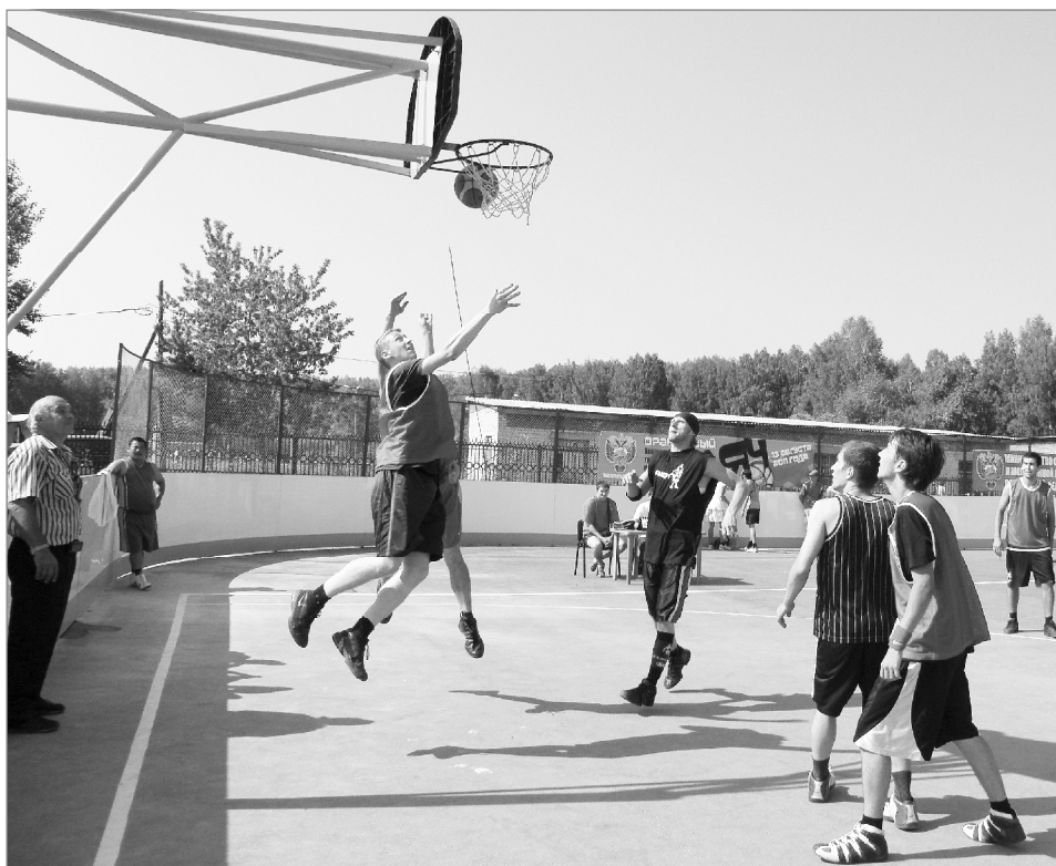
Ещё мгновение, и мяч в корзине