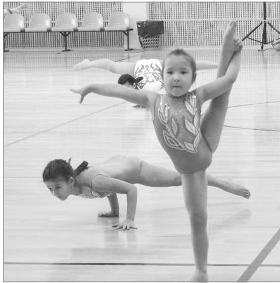
В акробатику - с «пелёнок»

Вносит свою лепту в спортивную жизнь города Центр по спортивно-физкультурной работе и недавно открывшийся комплекс «Атлант». В последнем действуют пять залов, которые никогда не пустуют. На территории комплекса есть площадка для игры в мини-футбол с искусствен-