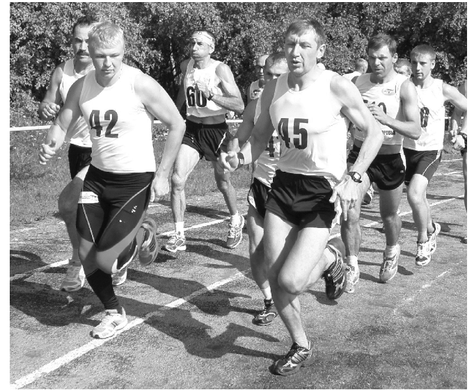
В спорте нет возрастных ограничений

ным покрытием, где тренируются взрослые игроки, а также проводится чемпионат города Ялуторовска среди дворовых команд.