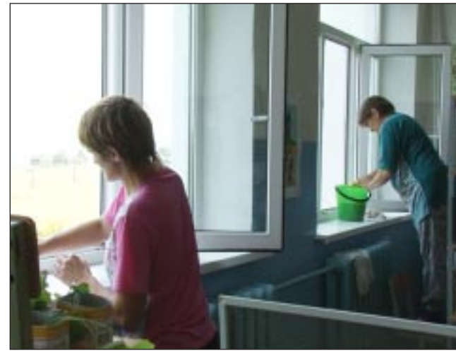
Окна в каждом кабинете сияют чистотой.