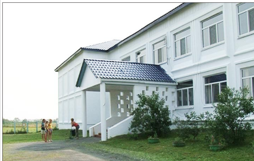
Алымская школа к началу учебного года практически готова.