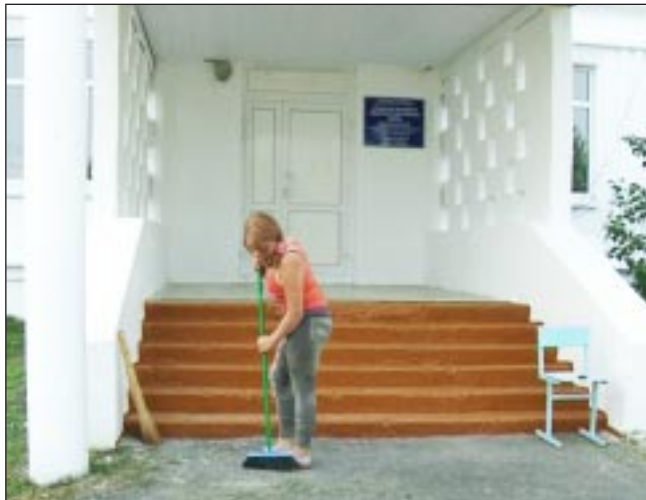
Крыльцо школы должно быть парадным.

Решается вопрос о строительстве в Горнослинкино модульного здания детского сада. Так как детей дошкольного возраста в селе не много и в ближайшие годы всплеска рождаемости не ожидается, строительство капитального здания не имеет смысла. Зато установка