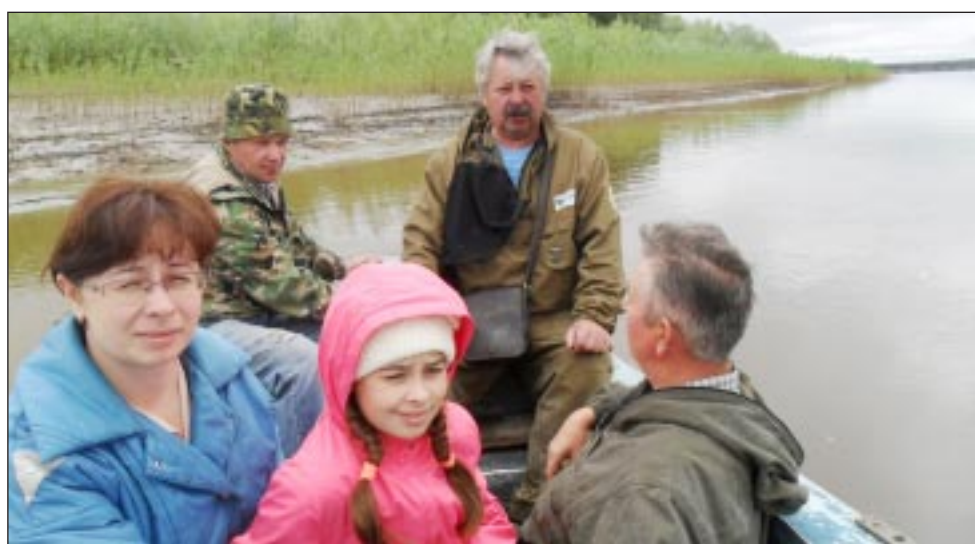
Едут навестить родную Луговослинкину её уроженцы.

- Было очень трудно в военное время. Всё держалось на женских плечах да на нас, пацанах. Но работали, не сдавались. Крупного рогатого скота и свиней в колхозе всегда было до 600 голов, лошадей - до 30. И потом, когда наш колхоз объединили с Горнослинкинским, поголовье подерживали, и землю пахали, и зерно сеяли на сдачу государству и на фураж... Детей растили. В детские дома, как теперь модно, не сдавали, всех поднимали, даже самых немыслимых. В середине девяностых годов отделение совхозное ликвидировали, невыгодное, наверное, стало содер-