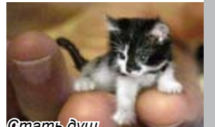
Стать душой человеческих дворничком, Повыместить грязь себялюбия, Жестокости мусор и зла, Иль просто подальше послать - Такие, братишка, дела. Мы - монстры, убийцы, не люди мы... Кормлю собачат возле мусорки, И вновь кровоточит душа, Вот так человек, не спеша, Забыл, как любить и прощать. Терпите, Мухтары и Мусеньки, Вернись, состраданье, сочувствие, В сердца и бетонные лбы, И стадное чувство толпы Призывом омой: «Возлюби!». Пусть клич этот станет напутствием.

Бросили осенью дачники Питомцев: щенят и котят, Не нужен в квартирах нам ад - То лают, то громко пищат. И бросили их, словно мячики, Где ж угрызения совести, Душевные муки, вина - Но всё бумерангом сполна Вернётся... Почти что война Меж кланами грустной сей повести: Люди, и рядом - животные, Члены семьи, как друзья, Под небом одна мы семья. В ответе все мы, ты и я, За тех, кто скулит за воротами, Жгут душу глаза беспризорника - Кота иль голодного пса. Чувств гамму нельзя описать, Хочу их прижать, приласкать, Стать душой человеческих дворничком, Повыместить грязь себялюбия, Жестокости мусор и зла, Иль просто подальше послать - Такие, братишка, дела. Мы - монстры, убийцы, не люди мы... Кормлю собачат возле мусорки, И вновь кровоточит душа, Вот так человек, не спеша, Забыл, как любить и прощать. Терпите, Мухтары и Мусеньки, Вернись, состраданье, сочувствие, В сердца и бетонные лбы, И стадное чувство толпы Призывом омой: «Возлюби!». Пусть клич этот станет напутствием.