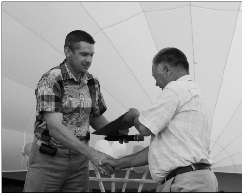
домами и красивыми улицами, детьми и внуками!

Таковыми словами начался праздник «День рождения села», прошедший в первых числах августа в с. Быструха. На площади около Дома культуры собрались в тот день почти все жители села, прибыло много гостей. Весело, радостно было на улицах села. И погода не подвела: было жарко и солнечно.