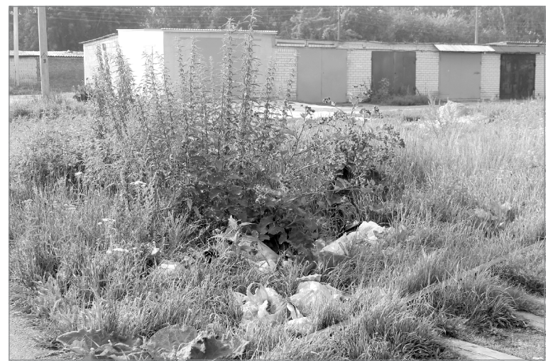
Кто уберёт очередную свалку?