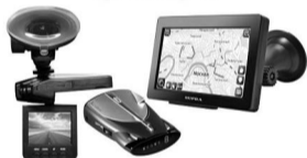
Автоэлектроника: навигаторы, видеорегистраторы, антирадары