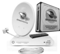
Комплект Триколор ТВ