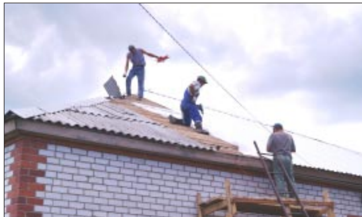
Завершается монтаж кровельного покрытия школы.