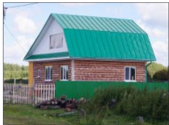
Новостройка семьи Юмагузиных.

Конечно, всё лето осуществлялись работы по очистке территории села от мусора, благоустроились кладбища. Кроме того, надо сказать, что в прошлом году в Уках было заменено 800 метров водопроводных труб и установлены пожарные гидранты. В настоящее время проводит-