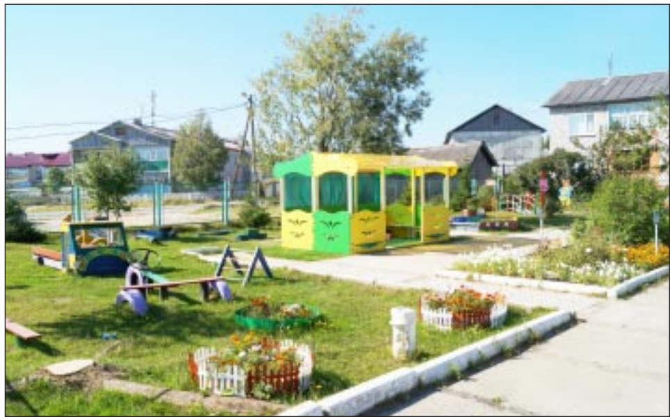
На площадках в детском саду «Солнышко» сделаны новые веранды.