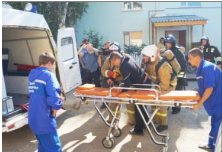
Все службы с поставленными задачами справились.