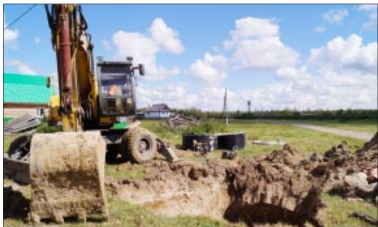
Продолжаются работы по замене водопровода.