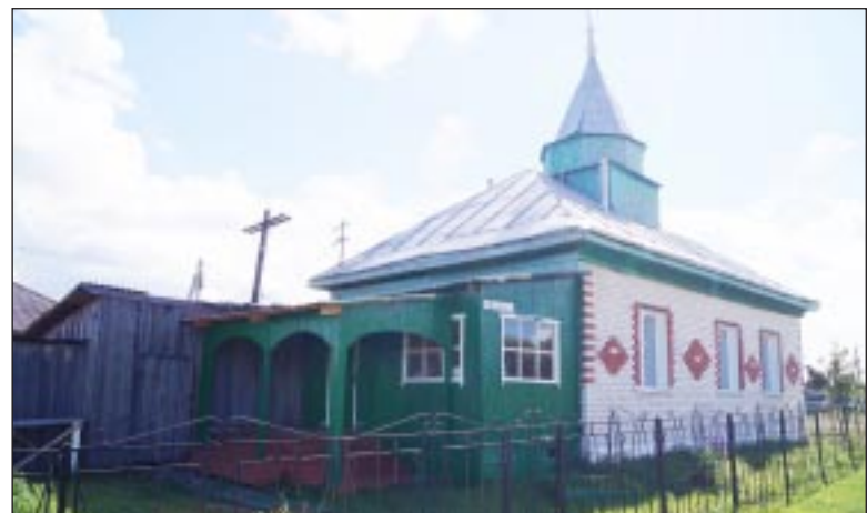
Мечеть - главная достопримечательность села.

- Да, мы подали заявку на установку модульного здания образовательного учреждения. Надеемся, что в скором времени оно у нас появится. Необходимо селу и спортивное сооружение, так как нашим детям и подросткам уже не хватает игровой зоны на центральной площади и тренажеров, что есть в Доме культуры. Уверен, если будут созданы со-