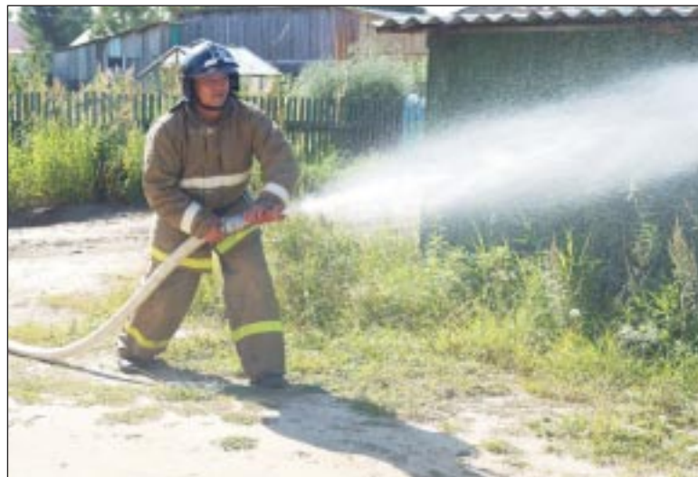
Пожарные ликвидируют очаг возгорания.

хомович. - Высокая оценка учений - это признательность вашей работы. Предполагался наихудший сценарий с тяжелыми условиями, поэтому мы не случайно выбрали именно левый берег Увата и многоквартирный дом. Люди везде должны чувствовать свою защищенность. Хотя не скрою, что нам приходилось подсказывать руководителям групп некоторые их действия, но это были незначительные замечания. Службы спасения и вспомогательные организации к ликвидации ЧС на территории Уватского района готовы.