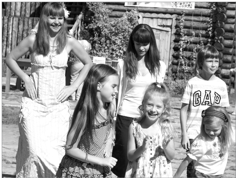
И стар и млад веселью рад!