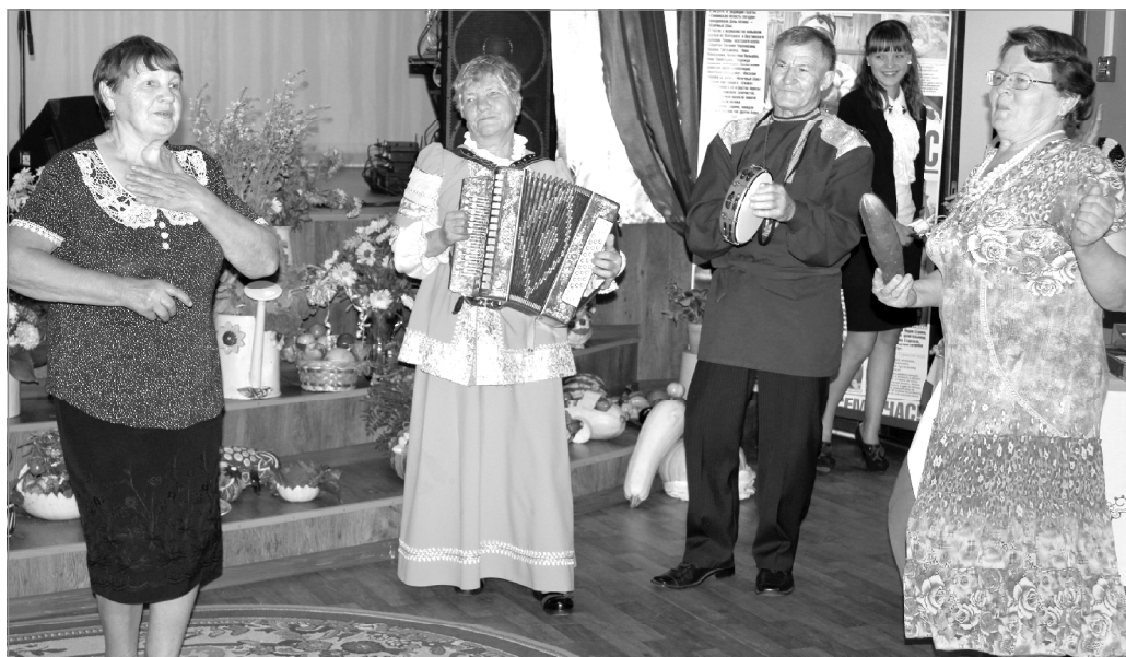
В свободное от огородных забот время и спеть сможем, и сплясать!