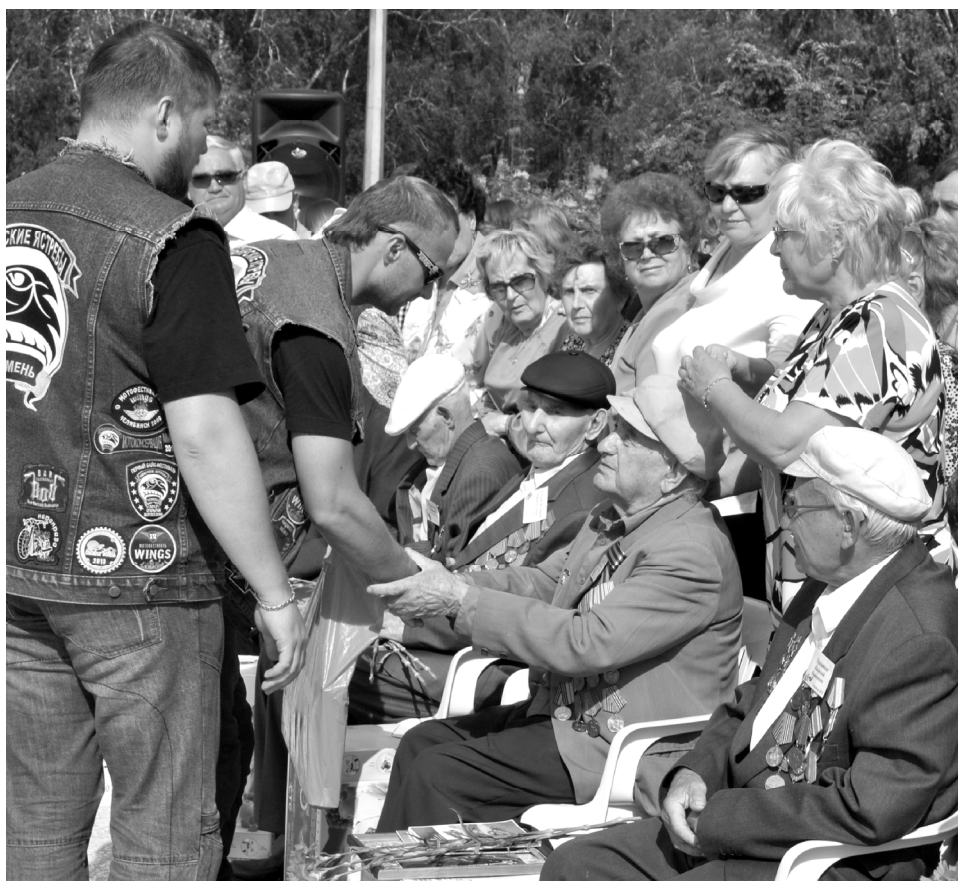
Спасибо за подвиг на Курской дуге!

- Хотим напомнить молодёжи, что нельзя забывать о тех днях. Мы с вами живём благодаря нашим ветеранам. Передаём привет от участников войны, которые