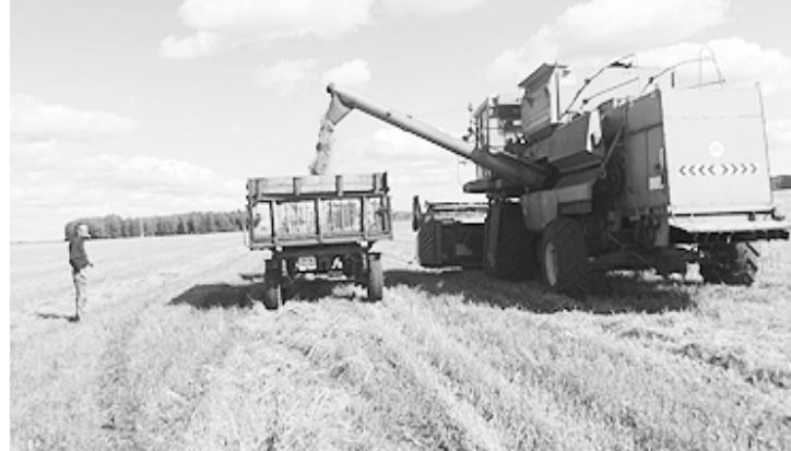
Роза ПАШКОВСКАЯ. Фото автора.

Начало уборке хлеба в ООО «Пинигинское» положено. Как она пройдёт, покажет время. На 27 августа намолочено 363 тонны зерна со 180 га полей.