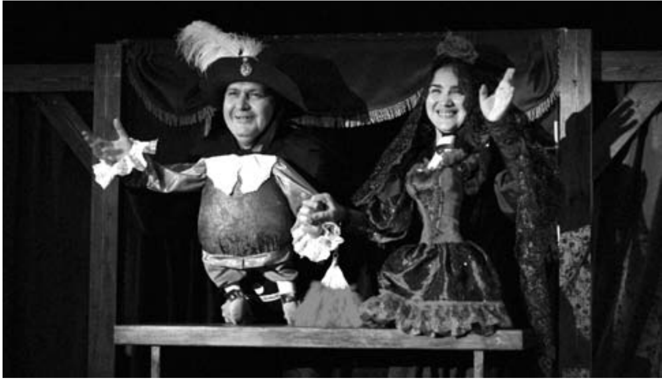
Сцена из «Каменного гостя». Куклы-тантамарески

Спектакль пронизан му- зыкой, как летняя веран- да старого дома произает поутру солнечными луча- ми. Музыкой, специально написанной для тобольской версии «Маленьких траге- дий» композитором Нико- лаем Морозовым. Музыкай