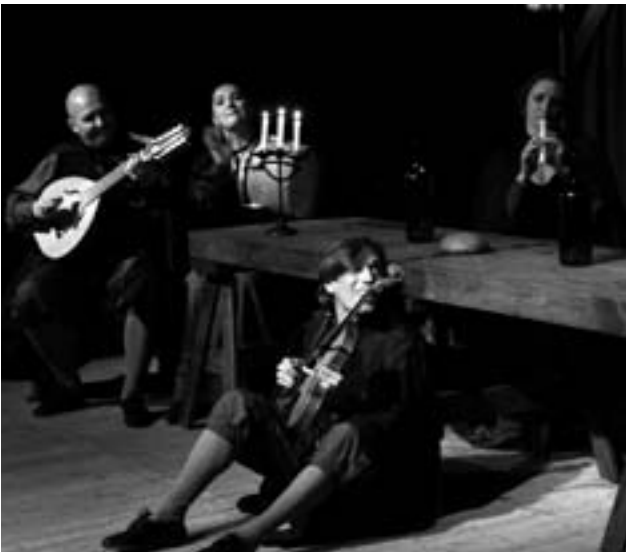
«Скупой рыцарь» – пролог

происхождения, решающие свои европейские средневе- ковые проблемы. Решающие совершенно по-петрушечьи – лихо, с шутками-прибаут- ками, силеча, наотмашь, с солью и перцем. И в какой-то момент, не- замотно и вкрадче, весь этот петроразгул превращается в высокую трагедию. Скры- га умирает с вечным вога- сом скупца над сундуком: «Где ключи? Ключи, ключи мои!» И страшно становит- ся, и вдруг забываешь, что всё это – только театр. И по- нимашь ещё раз простое ве- личие пушкинского: «Ужас- ный век, ужасные сердца!»