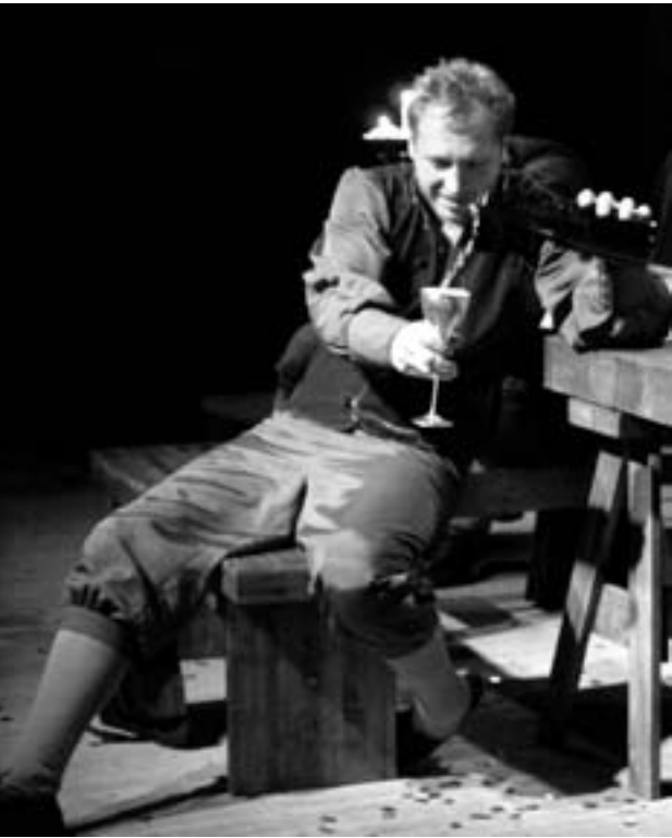
«Пир во время чумы»

Может быть, загадка как раз в этом «всего лишь»? Автор, режиссёр, компози- тор, художник-постановщик