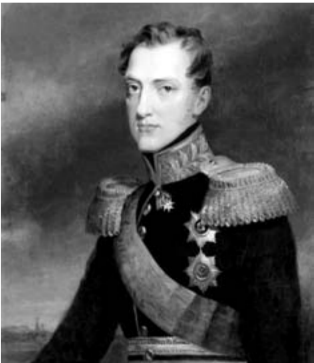
Великий князь Николай Павлович

уже в XX веке потерял контроль над ситуацией, и Российская империя, создаваемая веками, рухнула почти в одночасье... Может быть, А в 1825-м гвардейская артиллерия расстреляла карею (а заодно и «чернь», собравшуюся только некоторая трювка в народе, она я наденось, рассеется... Наши аресты проходят очень успешно, и у нас в руках все главные герои этого дня, кроме одного».