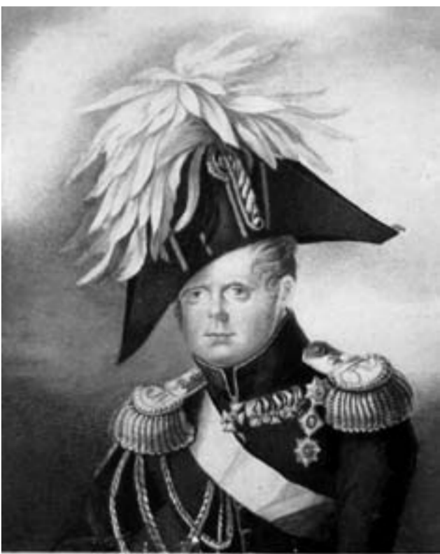
Великий князь Константин Павлович

Восстание декабристов было подавлено жестоко... Но есть ли другой эффективный путь для предотвращения смуты? Может быть, этой жестокости (даже жестокости) не хватало другому Николаю Романову, который