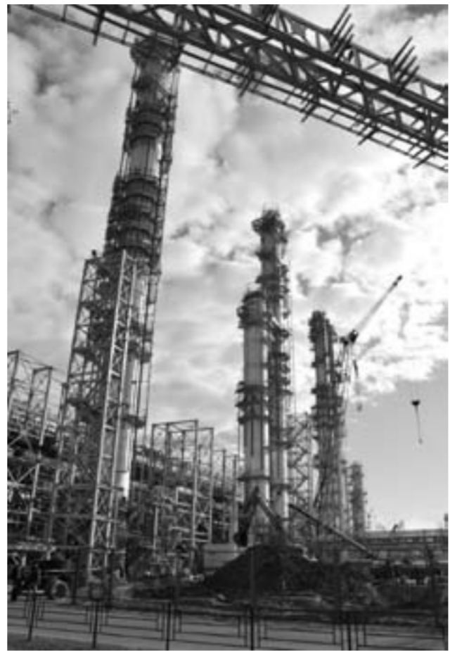
На строительных работах по всему комплексу по переработке ШФЛУ занято более 2 тыс. рабочих. Сергей ЗВЕРЕВ

В настоящее время на проекте завершаются работы по монтажу металлоконструкций и трубопроводов, идёт работа по теплоизоляции оборудования и трубопроводов, выполняется прокладка кабеля, монтаж электротехнического и контрольно-измерительного оборудования. Параллельно уже начались пусконаладочные работы, в частности испытания на плотность и прочность оборудования и трубопроводов.