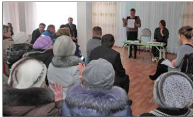
Встреча в Подрезовой