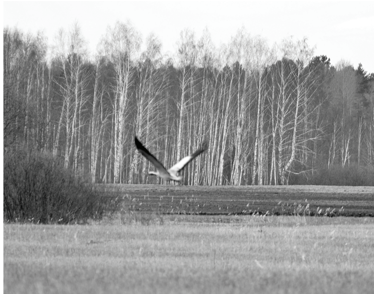
Лети же, весточка, как эта птица над полем, лесом в облака... Будь яркой, светлой, как зарница, и долгожданной и легкой!