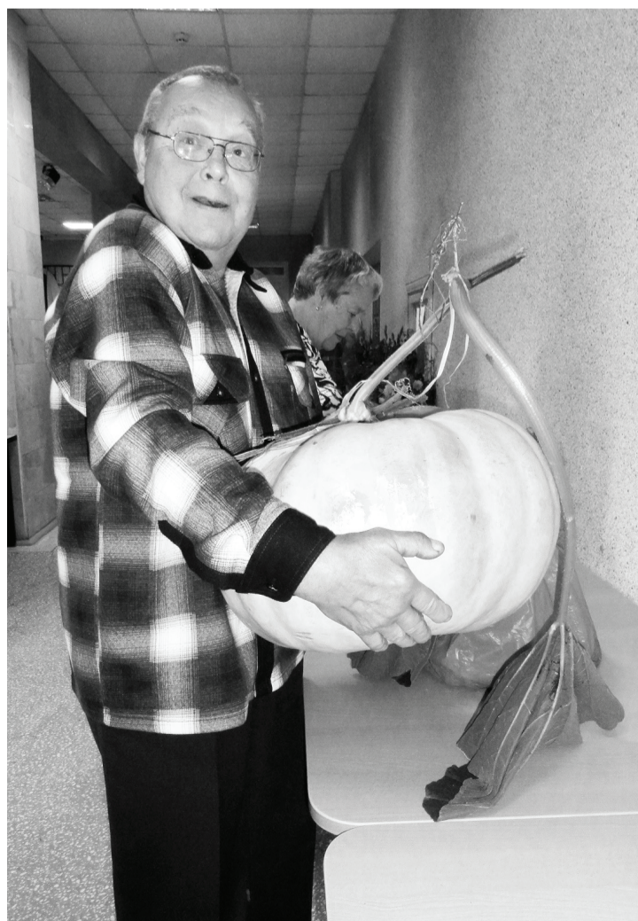
Ух, еле поднял!

Елизавета ФОМИНЦЕВА, Тамара МАНЯХИНА (фото)