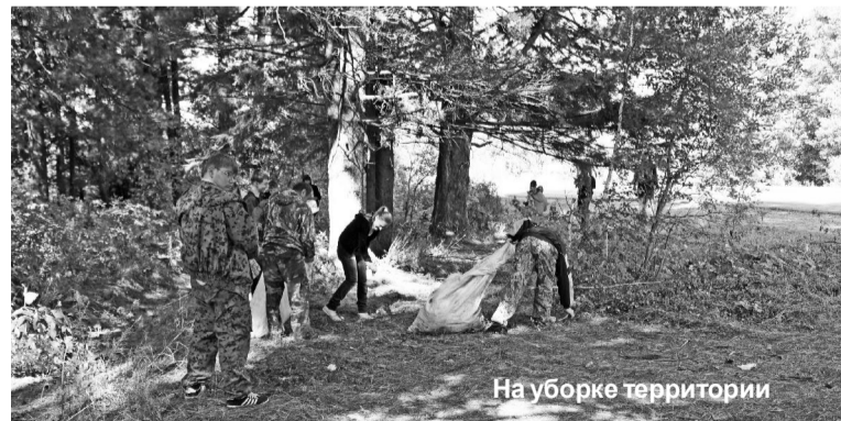
На уборке территории

Седьмого сентября отряд во главе со своим руководителем отправился на очистку Шевелевского бора. Все мы не понаслышке знаем, в каком состоянии находился въезд в кедровник.