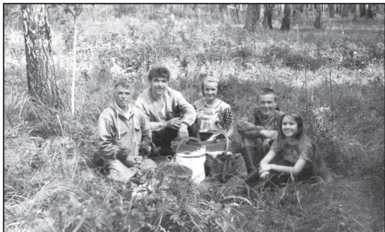
За брусничкой. Три поколения семьи Сергеевых

с. Агарак Н. ЧЕРКАСОВА