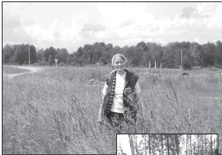
Родные всё места...