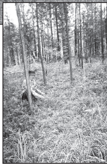
Местечко Гараж. Собираем чернику

Отчего легко и хорошо? Насколько мне дорог лес, поняла, когда долго не была там из-за болезни. А как хотелось! Стояла земляничная пора. Влезу на самую верхнюю ступеньку лестницы, приставленной к сеновалу, и подолгу смотрю в сторону бора. Вот он, как на ладони, волнистой стеной стоит. Манил меня туда неведомая сила. Утром, никому не сказавшись – иначе бы не отпустили, взяла бидончик и по огороду, затем по полевой дороге отправилась на заветное местечко. Вот уж Таповская дорога, силосная траншея, мимо рощицы по болотинке – по знакомой тропке – напрямик к речке! Но брёвнышка-перехода не оказалось, пришлось берегом до моста идти. Устала. И тут вижу: на склоне берега ключик бьет. Словно в сказке! Вода чистая, прохладная. Отдохнула – и по дорожке в лес. Моя полянка! Опять я с тобой! Набрала-таки посудину. Обратно дошла с трудом, но была