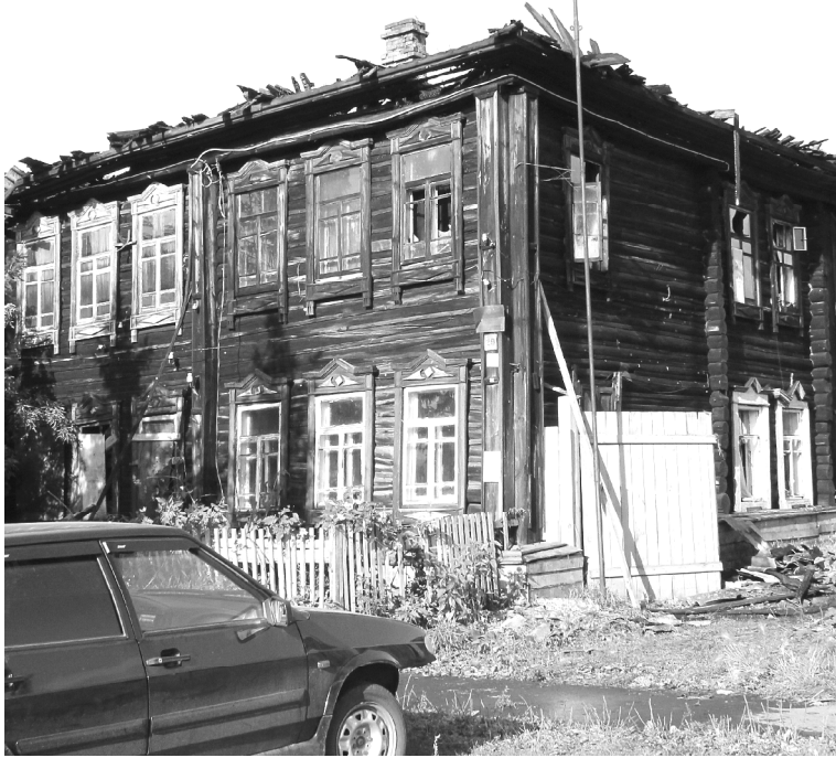
Причина пожара и виновные лица устанавливаются

С начала года в Ялutorовске и районе зарегистрировано 57 пожаров. В огне погибли два человека, один получил ожоги.