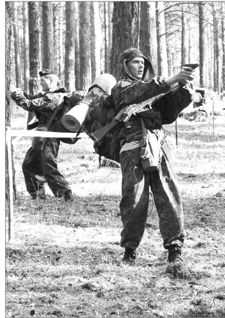
«Прорыв»: стреляем метко, стреляем далеко