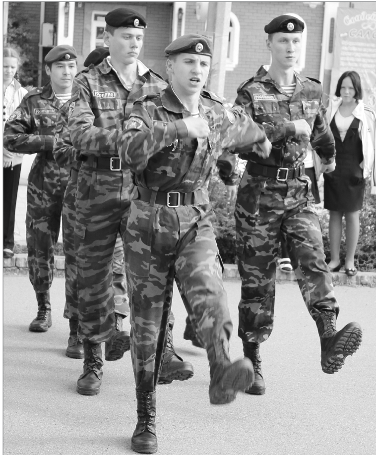
«Суворовский натиск-2013» посвящался 70-летию победы в Курской битве