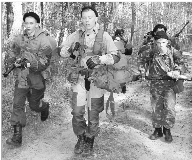
Главное - найти этап и не заблудиться в лесу

В седьмой раз на ялуторовской земле состоялась военно-спортивная тактическая областная игра «Суворовский натиск». Ежегодно в ней участвуют лучшие представители специализированных классов добровольной подготовки к военной службе со всех уголков юга области. На этот раз команд было семнадцать.