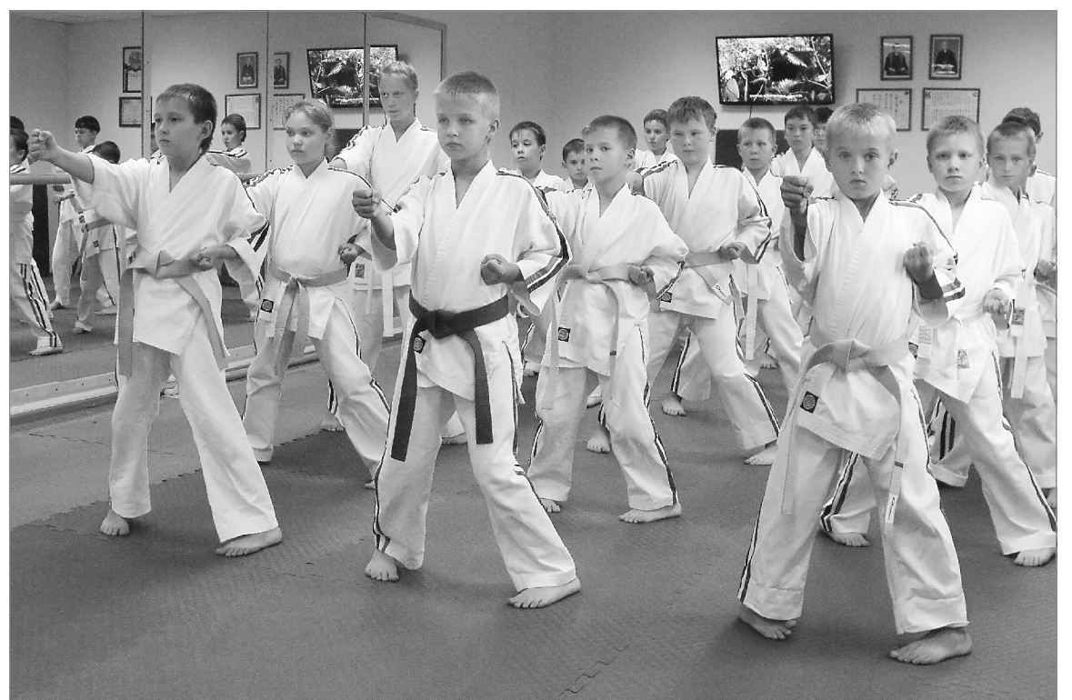
Летом клуб «Фалькон» превратился в тренировочную базу юных спортсменов