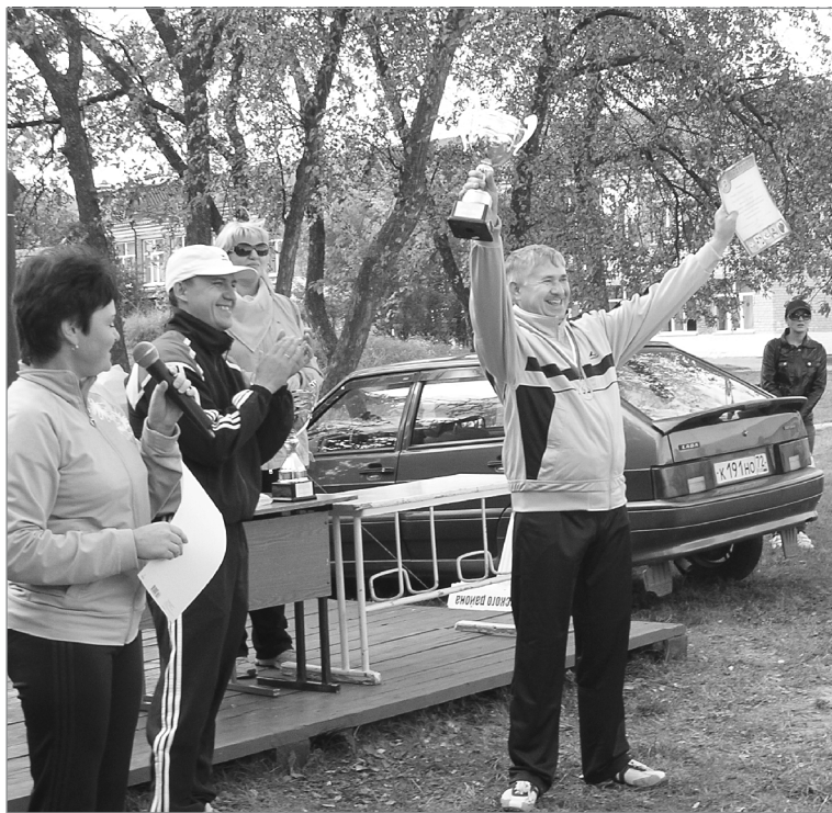
«Серебро» - у администрации района