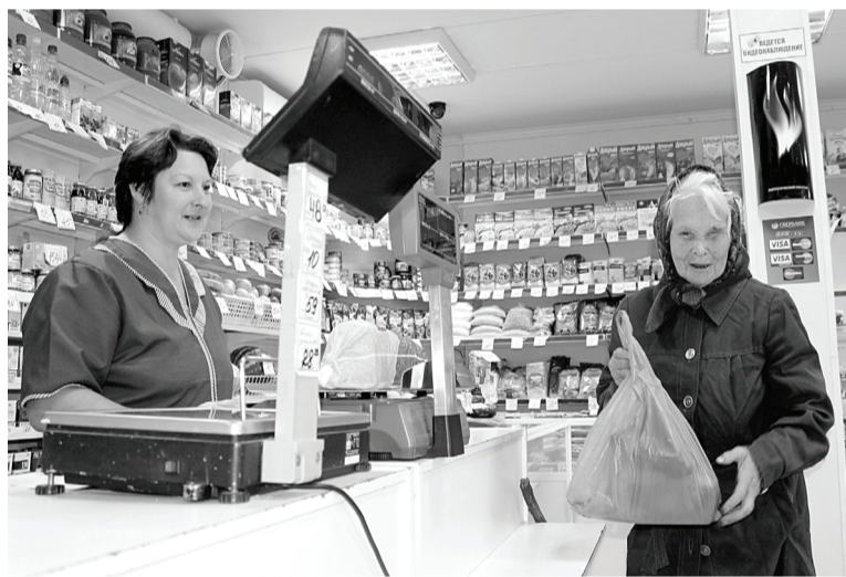
Отличное настроение у продавщицы – значит, и покупатель доволен.

общения с продавцами. В магазине «СтройСам» введён дресскод, это приятный момент для продавцов и тех, кто приходит за покупками.