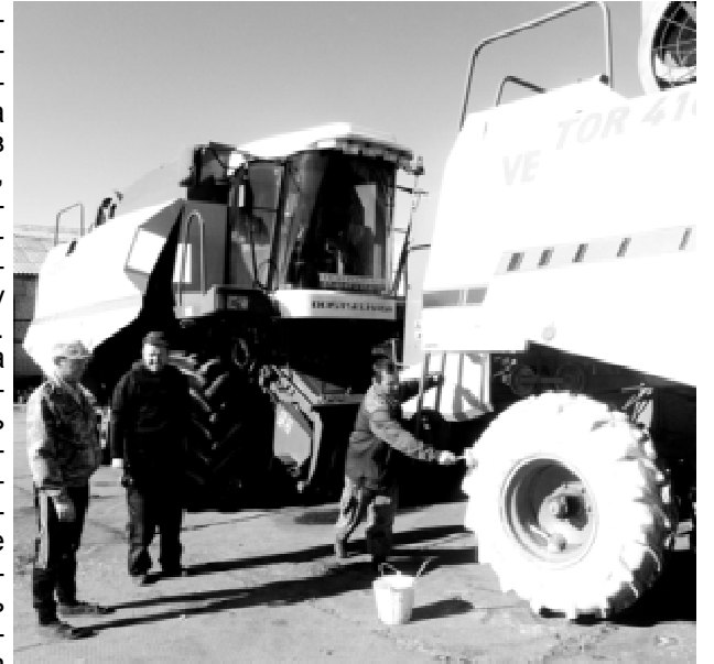
Работники СПК "Сибирь" готовят технику к зиме

На вопрос — жалеете ли вы о чём-то в своей жизни? — ответила: «Зачем жалеть, если уже ничего не изменить, считаю — что на роду написано, того не избежать, только можно что-то