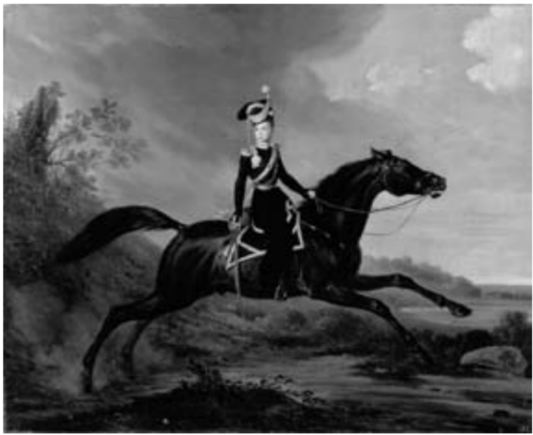
Цесаревич Александр Николаевич