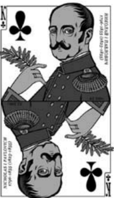
Николай I. Из «императорских карт» Алексея Орлеанского

Из записок секретаря Анатолія Николаевича Демидова (знаменитого князя Сан-Дonato): «Царь - самодержец если отличает женщину на прогулке, в театре, в свете, говорит одно слово дежурному адъютанту. Особа, привлекающая внимание божества, попадает под надзор».