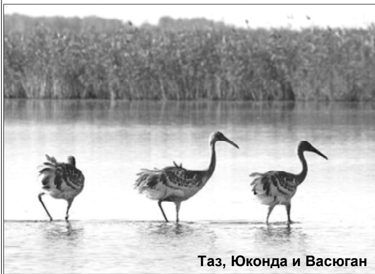
Таз, Юконда и Васюган