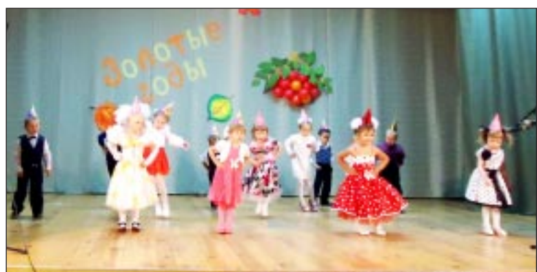
С праздником поздравляют воспитанники д/с «Малышок».

В празднично оформленном зале ДК «Нефтяник» с. Демьянское состоялась замечательный концерт, посвященный Дню пожилых людей.