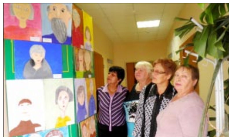
На выставке детских рисунков.

ная в программе, находится в библиотеке и вызывает живой интерес читателей. А организаторам этого