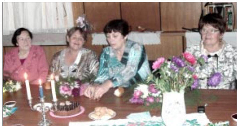
Девичьи гадания предсказали всем удачу.