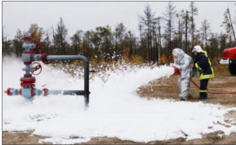
Возгорание нефти успешно ликвидируется.

Разлившаяся нефтяная эмульсия вспыхнула буквально на глазах, а еще через несколько секунд пламя перекинулось на стоящий рядом вагон-слесарку. Там предположительно находился человек.