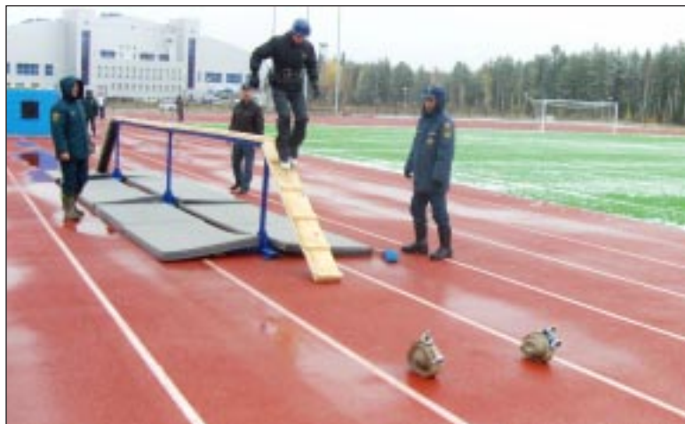
Для юных пожарных мокрое бревно не стало препятствием.