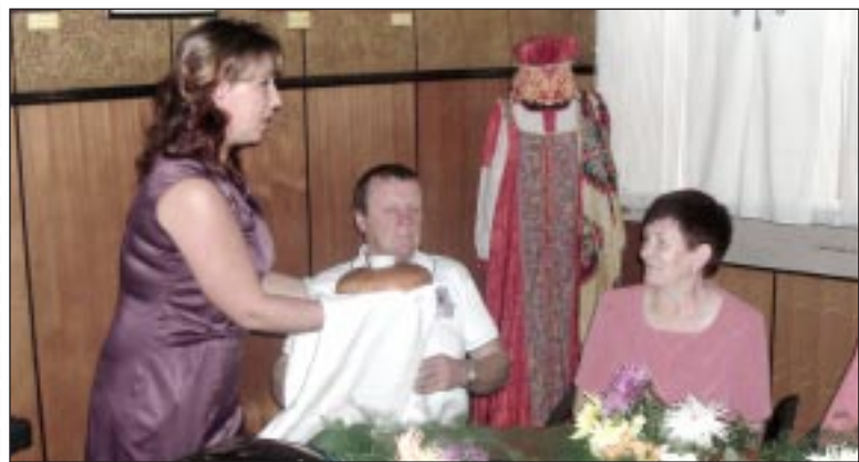
Красивый, ароматный каравай для именинников.