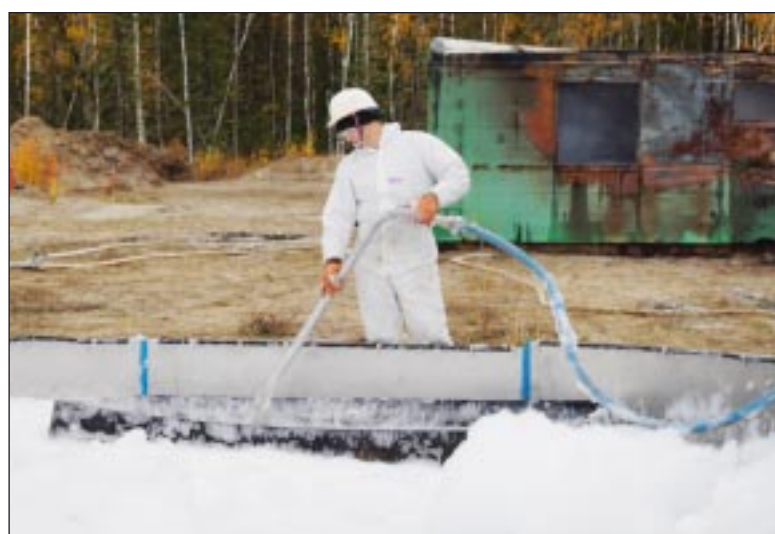
Спецподразделение Кальчинского месторождения производит сбор разлитой нефти.