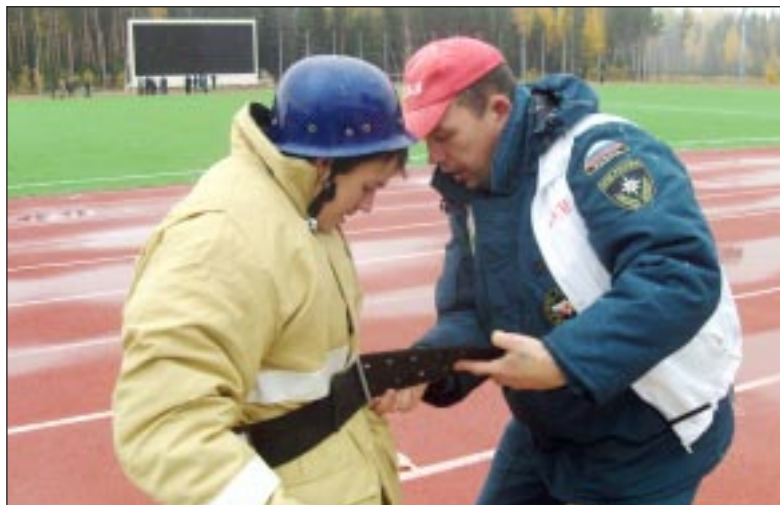
Старший товарищ всегда поможет в сложной ситуации.