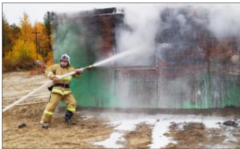
Спасатели приступили к тушению немедленно.

30 сентября в 9 часов утра произошла авария на нефтяной скважине № 1 «У» Кальчинского месторождения с возгоранием нефтяной эмульсии и находящегося рядом вагона-слесарки. Причиной стала небрежность мастера бригады КРС, который в тот момент производил ремонтные работы фонтанной аппаратуры.