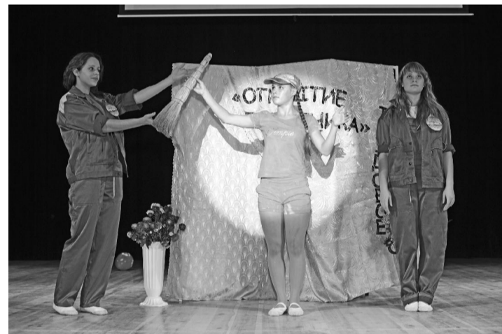
На снимках: «визитка» команд (сверху вниз) Вагайской, Супринской, Зареченской школ.