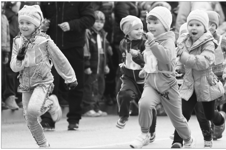
Задору детей можно позавидовать