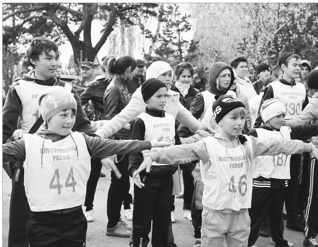
На зарядку становись!