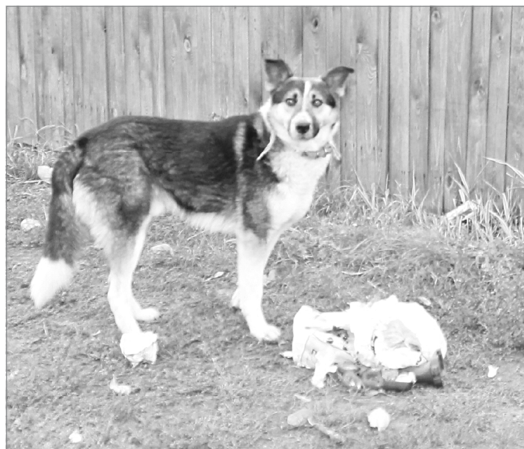
У большинства свободно разгуливающих по городским улицам собак есть хозяева

Проблема бездомных и безнадзорных животных не перестает быть актуальной. Как сформировать в обществе ответственное отношение к домашним питомцам, в частности, к собакам?