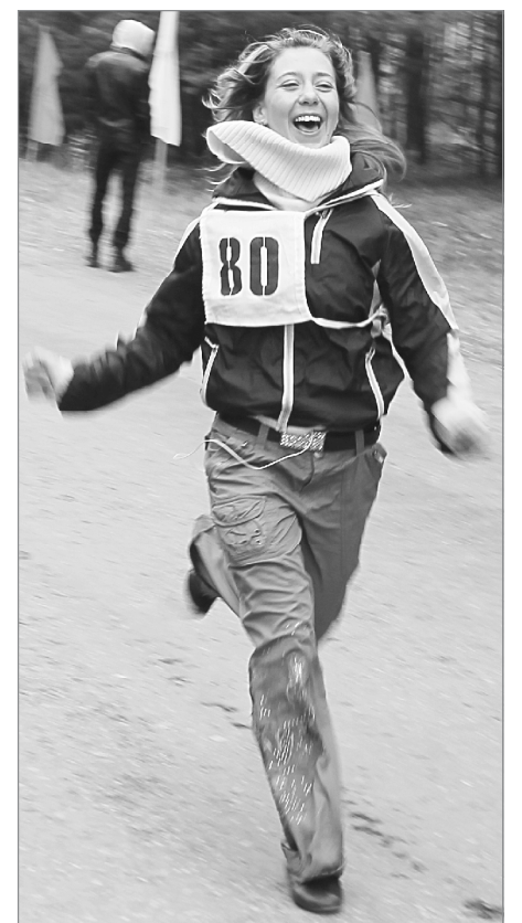
Ещё мгновение - и финиш!