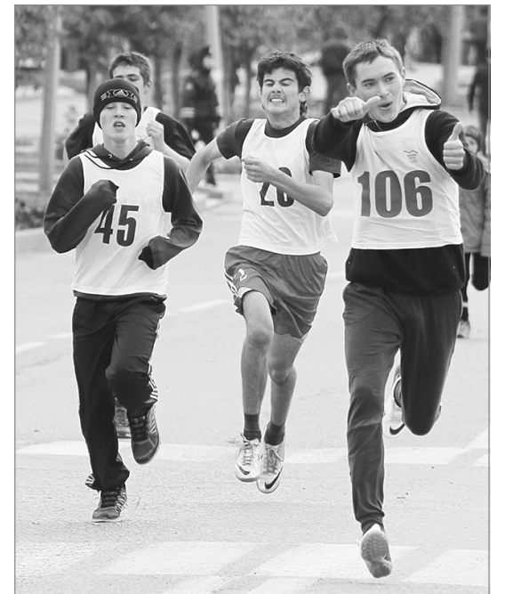
Победа уже в руках

Всех участников забега на финише ждали горячий чай и шоколад. Организаторами легкоатлетического кросса выступили комитет по физической культуре и спорту администрации города,