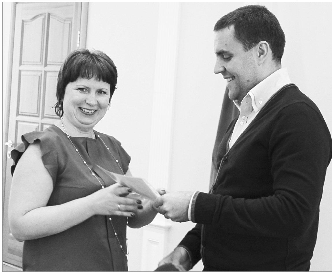
Вручение свидетельства по программе «Молодая семья»

По областной целевой программе «Молодая семья» ещё 56 ялуторовских семей стали счастливыми обладателями свидетельства на общую сумму 51 миллион рублей.