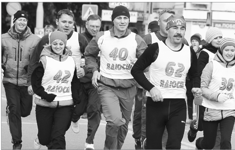
На старт - с настроением

Свыше шестисот ялutorовчан вышли в минувшую субботу на старт городского легкоатлетического пробега, состоявшегося в рамках Всероссийского дня бега и областного Дня здоровья. Это почти на сто человек больше, чем год назад. Испытать себя пожела-ли, как говорится, от мала до велика: воспитанники детских садов и учащиеся средних школ, студенты учебных заведений, представители предприятий, пенсионеры.