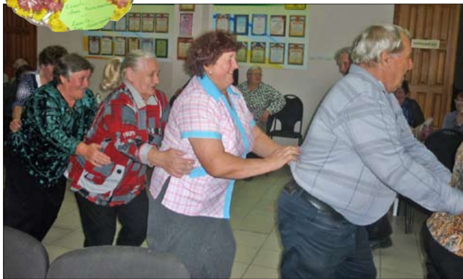
Байкаловские пенсионеры отдохнули от души