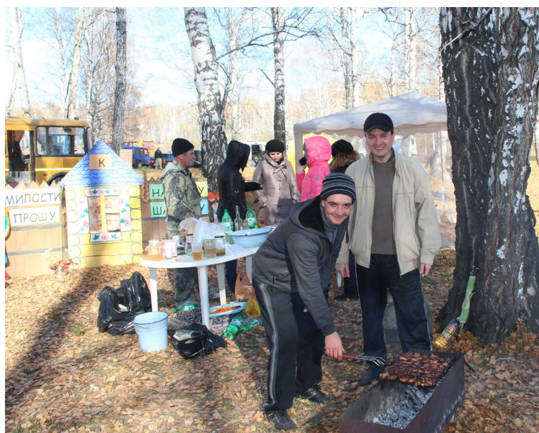
Какой отдых без шашлыка?!