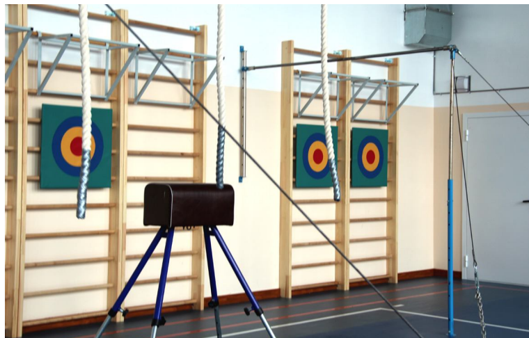
Интерьеры спортивного зала МАОУ Вагайская СОШ