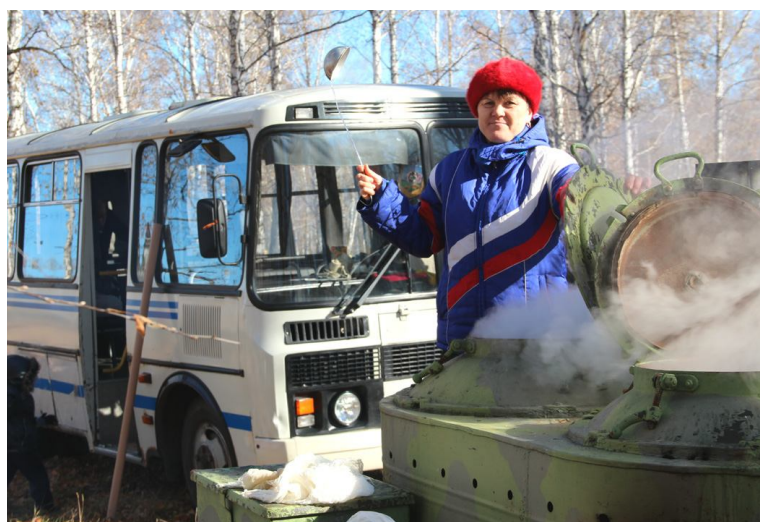
Манит дымок от полевой кухни

Итоги заключительного этапа II районной Спартакиады трудовых коллективов 2013г. были подведены на церемонии закрытия. Награды получили самые достойные. Ими стали: