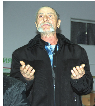
«У меня к вам вопрос, депутат»

И все же причину того, что вода после того, как открывается кран, издает неприятный запах, искать будут. Так заверили вагай-