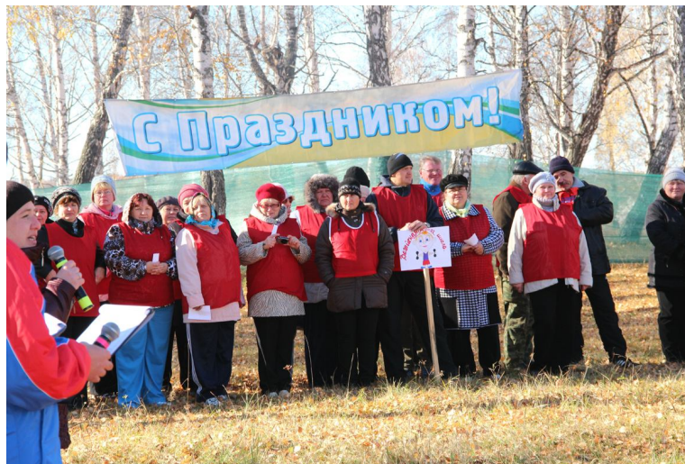
Для Вагайской СОШ День здоровья - праздник. Педагоги впервые участвуют общим составом

Об итогах Спартакиады читайте на 5-й стр.