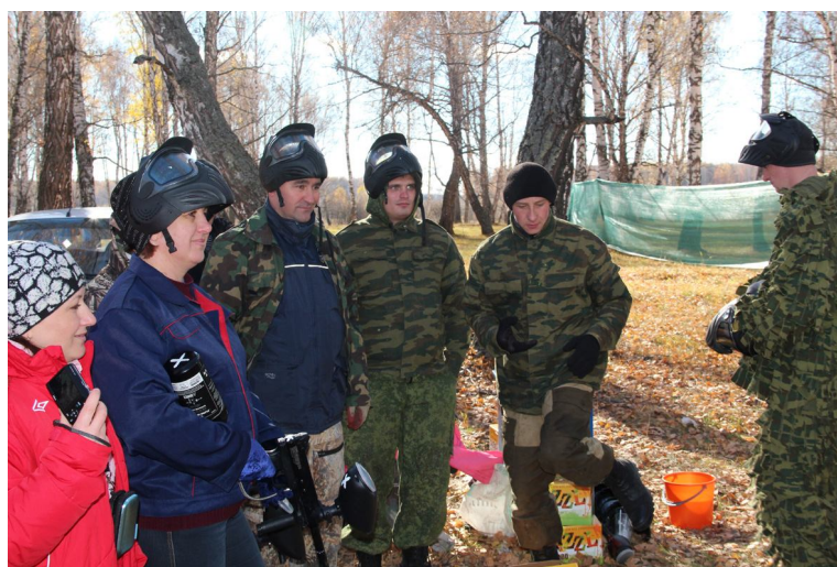
Команда администрации района: «Мы принимаем бой!»