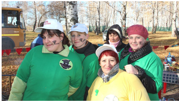
Отличное настроение у команды «Торнадо» из Ю-Плетневской СОШ