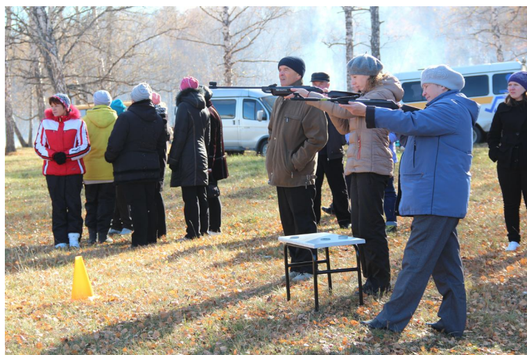
Точно в цель