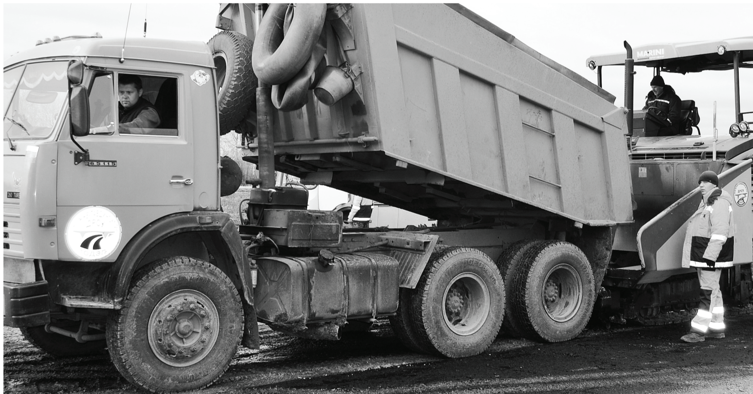
Процесс идёт, и наблюдать за ним – одно удовольствие. Однако работа не из лёгких и на холодном ветру. Просто каждый своё дело знает.

Мы хотим жить цивилизованно и красиво! А как это представить без ровных и ухоженных дорог с чёткой разметкой, знаками и аншлагами, без подъездов к жилым домам, офисам и объектам социальной службы, без тротуаров, площадей и мостов? Это всё достигается трудом Нижнетавдинского дорожного ремонтно-строительного управления. Честь и хвала за это работникам дорожной отрасли, которая является движущей силой экономического развития территории!