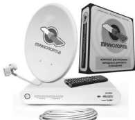
Комплект Триколор ТВ