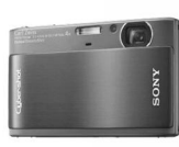
Фото и видео