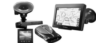
Автоэлектроника: навигаторы, видеорегистраторы, антирадары