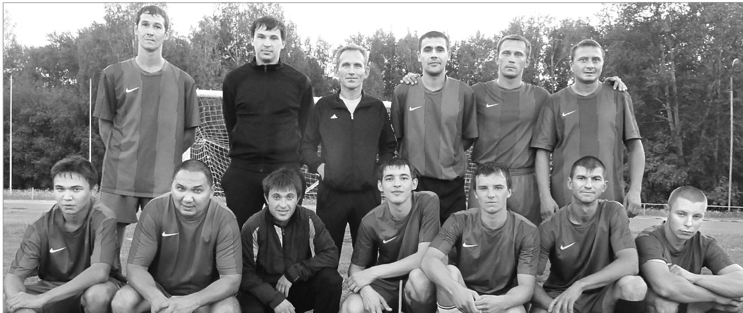
Футбольная команда «Дорожник» Ялуторовского ДРСУ