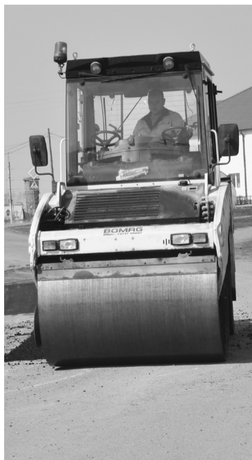
Ямочный ремонт дорог