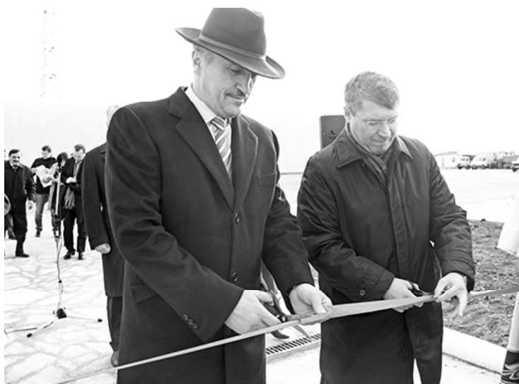
* На открытии завода

— Сладковский район называют краем голубых озёр. Общая площадь озёрного фонда составляет более 25 тысяч гектаров. Богатый природный потенциал делает рыбную отрасль инвестиционно привлекательной. Сладковское рыбноводческое хозяйство успешно и динамично развивается, функционируя по принципу: «из озёр — до потребителя». Данная технологическая цепочка позволяет предприятию уверенно чувствовать себя в суровом и жёстком рыночном море. Реализация всех проектов проводится здесь с учётом создания новых рабочих мест.