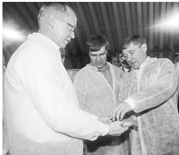
* Демонстрация тилипии