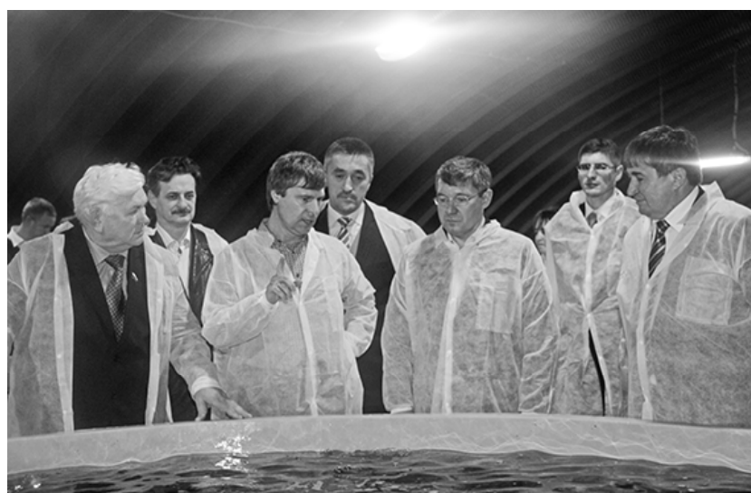
* У подросткового модуля