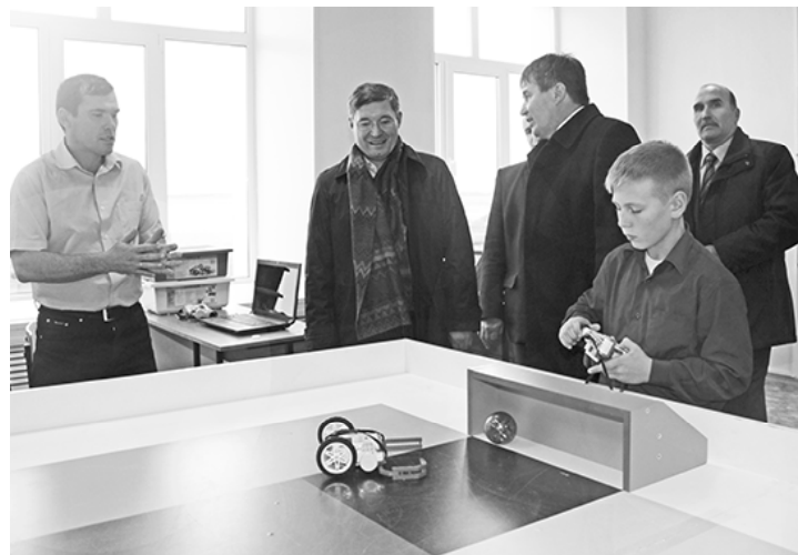
* В Доме детского творчества «Галактика»