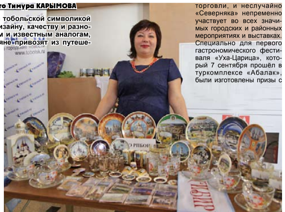
Сувениры, посвящённые Жемчужине Сибири