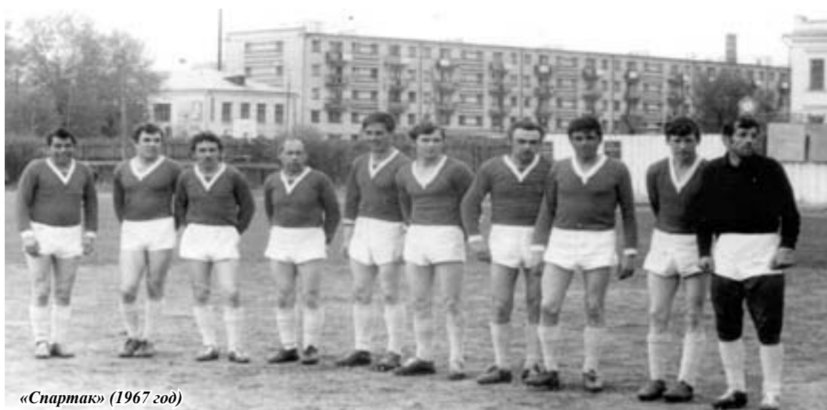
«Спартак» (1967 год)

«Закончились футбольные баталии летнего 2013 года сезона. Его анализ остаётся на совести