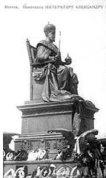
Памятник у храма Христа Спасителя в 1912 г. и в 1918 г.

Доктора сделали вывод, что травма спины привела к болезни почек. С той поры состояние здоровья Александра ухудшалось.