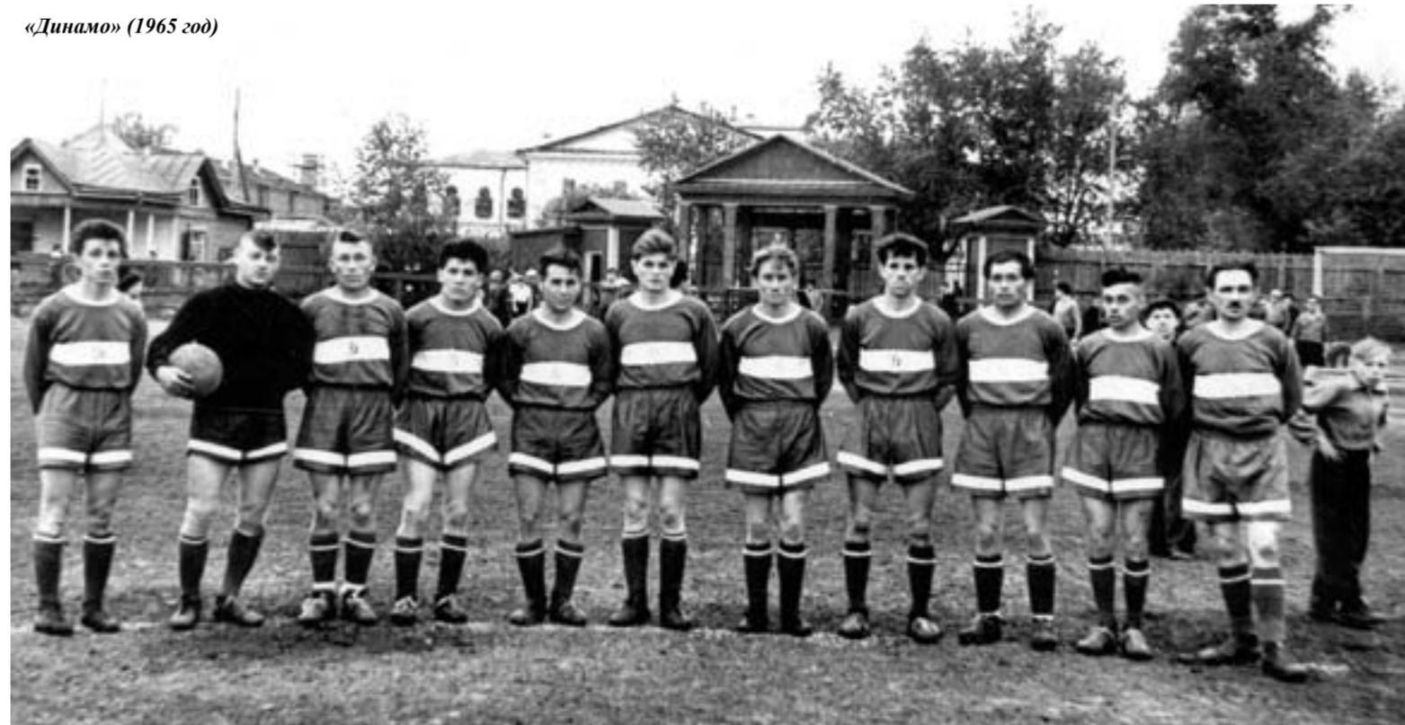
«Динамо» (1965 год)