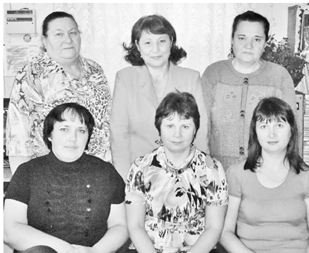
* Коллектив метеорологов

Как тянула, как звала её малая родина, когда после окончания технического училища уехала в Магадан. Замуж там