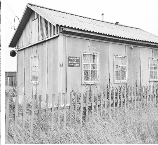
* Здание метеостанции

Наталья БАРКОВА, специалист по связям с общественностью Обь-Иртышского направления Гидрометслужбы