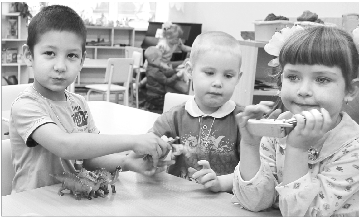
Наш детсад теперь самый-самый!