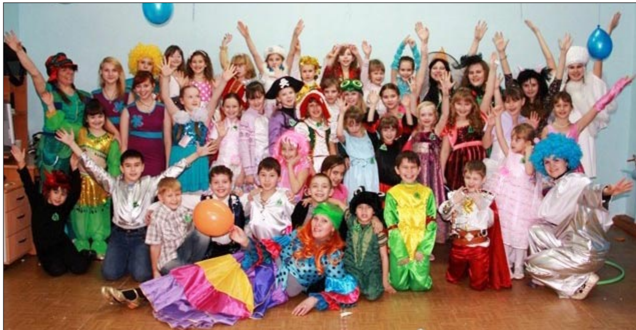
Воспитанники Центра дополнительного образования детей и молодёжи.