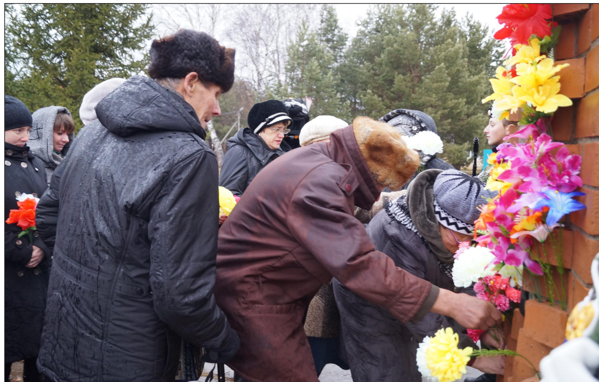
Уватцы возлагают цветы к памятнику жертвам политических репрессий.