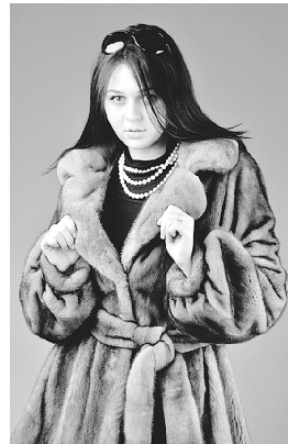
«Русфинансбанк» Ген. лиценз. ЦБ РФ N 1792.

Скидки на всё до 50%! Предоставляется кредит до 3 лет без первоначального взноса. Нужны только паспорт и страховое свидетельство. ВЫСТАВКА-ПРОДАЖА СОСТОИТСЯ в ДК «Юность», ул.Ленина, 7 с 9.00 до 19.00