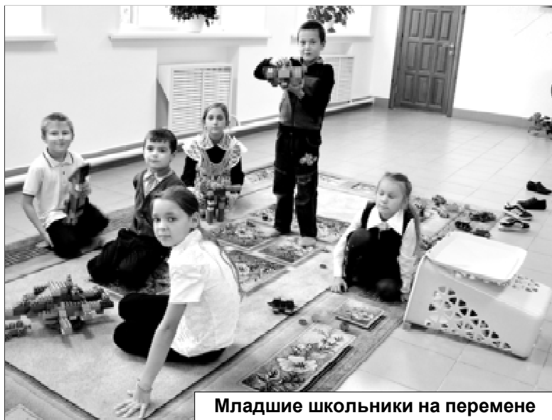
Младшие школьники на перемене