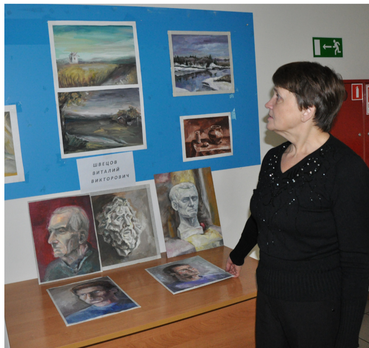
В программе праздника — выступления местных артистов и выставка художников