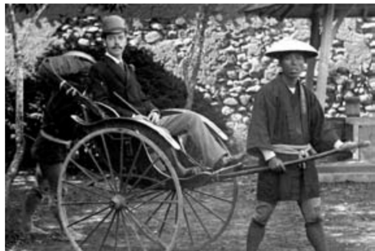
Цесаревич передвигается на рикше

В Страну восходящего солнца крейсер цесаревича в сопровождении 6 кораблей русского флота прибыл 15 апреля 1891 года.