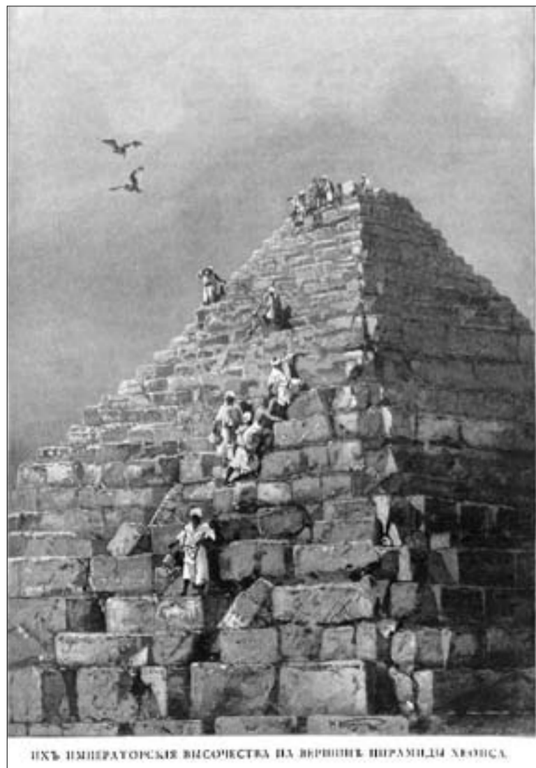
Ихъ Императорскаго Высочества на вершинѣ пирамиды Хеопса.

Дмитрий КАРАСИЕР Использованы рисунки Н.Н. Каразина – художника, сопровождавшего цесаревича