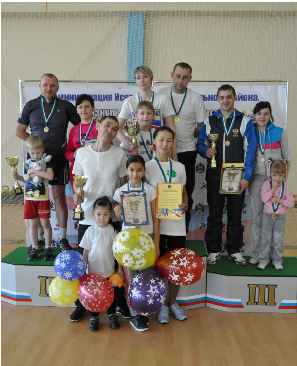
Участники и призёры районных соревнований «Папа, мама, я – спортивная семья»