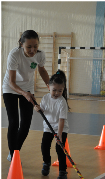
Чтобы выиграть, нужно было пройти ряд испытаний