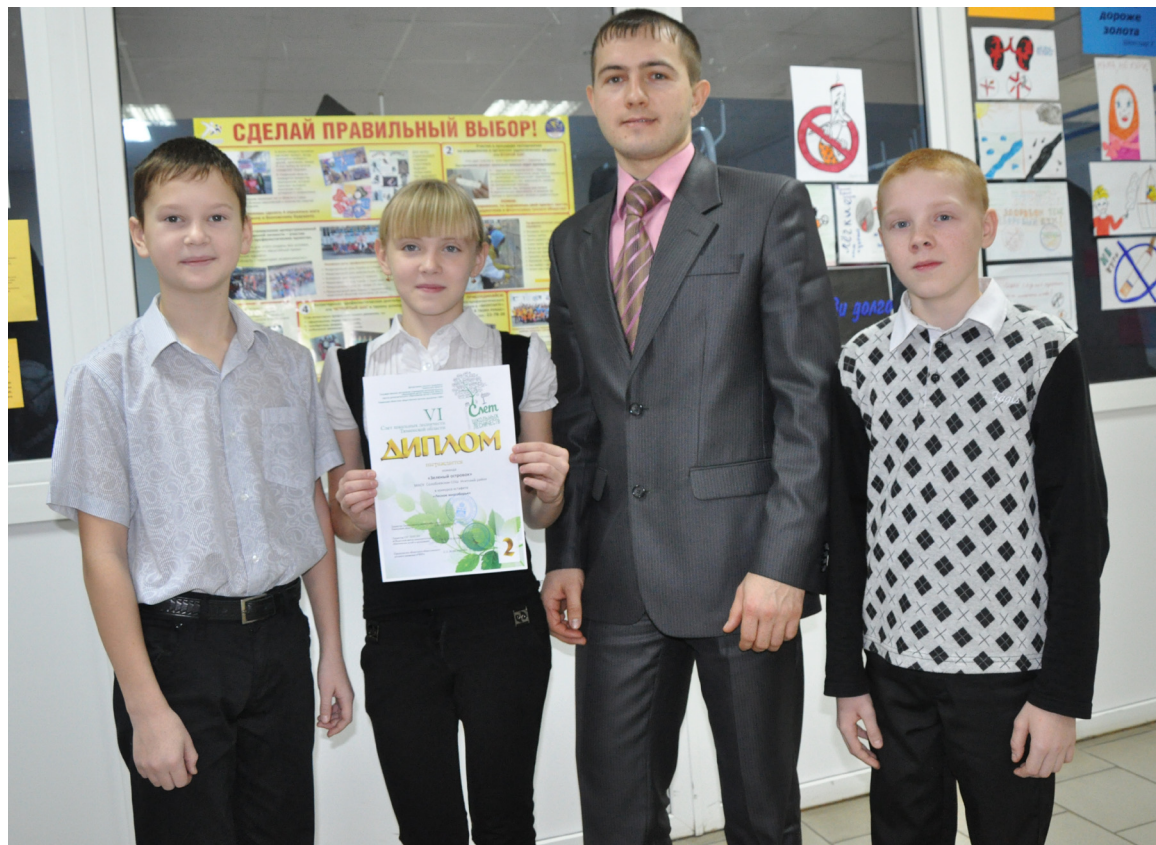
Солобоевские шестиклассники – серебряные призёры VI областного слёта школьных лесничеств

Познавательным получился этап «Костёр». Из множества брёвнышек участникам пред-