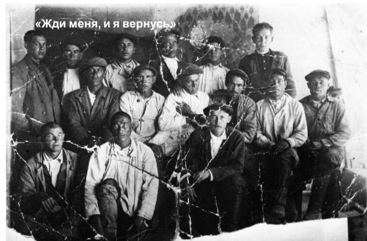
«Жди меня, и я вернусь»

творчества, формирования эстетической культуры, умений самостоятельного поиска нужных материалов.