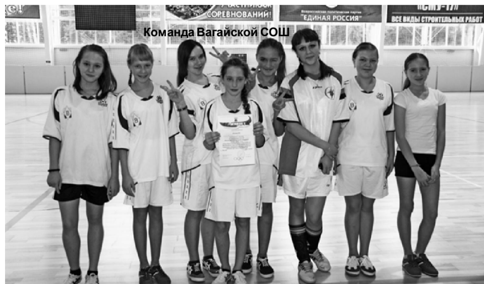
Команда Вагайской СОШ

щью серии пенальти. Точнее пробили пенальти и надежнее стоял в воротах вратарь черноковской команды, в результате минимальный перевес в их пользу – 2:1, и, соответственно, третье место.