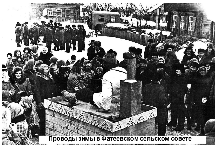
Проводы зимы в Фатеевском сельском совете