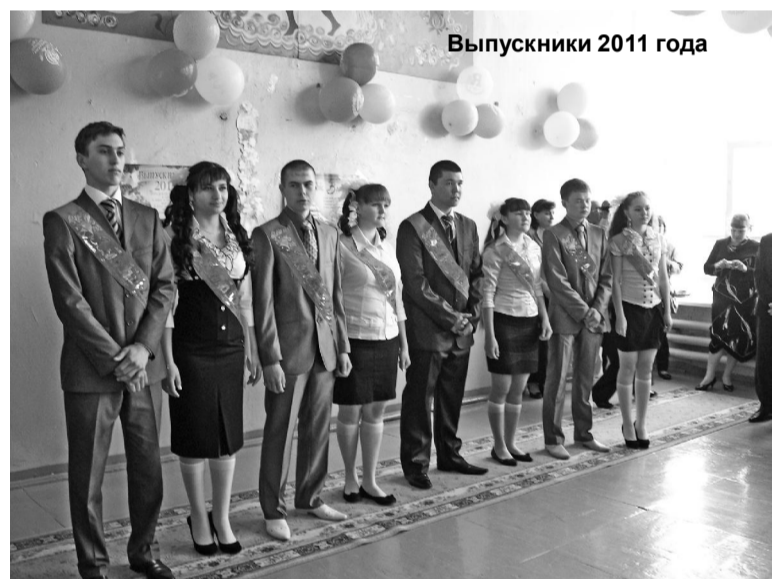
Выпускники 2011 года