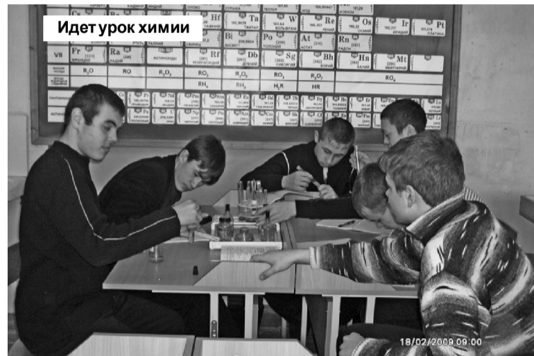
Идет урок химии

А память возвращает нас в 70-ые годы. В нашем поселке, в то время называвшемся поселком имени Ю.А. Гагарина, шло бурное строительство: возводилась нефтеперерабатывающая станция «Вагай», строились дома, клуб, детский сад. Но объектом особого внимания строителей была школа. Да и не могло быть иначе. Ведь школа – основа стабильной жизни людей, воспитывающих детей. Юным жителям поселка нужна была красивая, светлая школа.