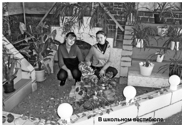
В школьном вестибюле