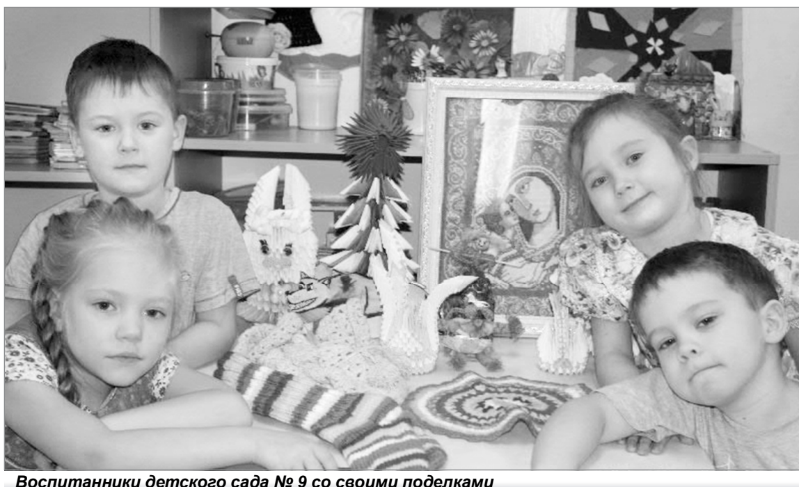
Воспитанники детского сада № 9 со своими поделками