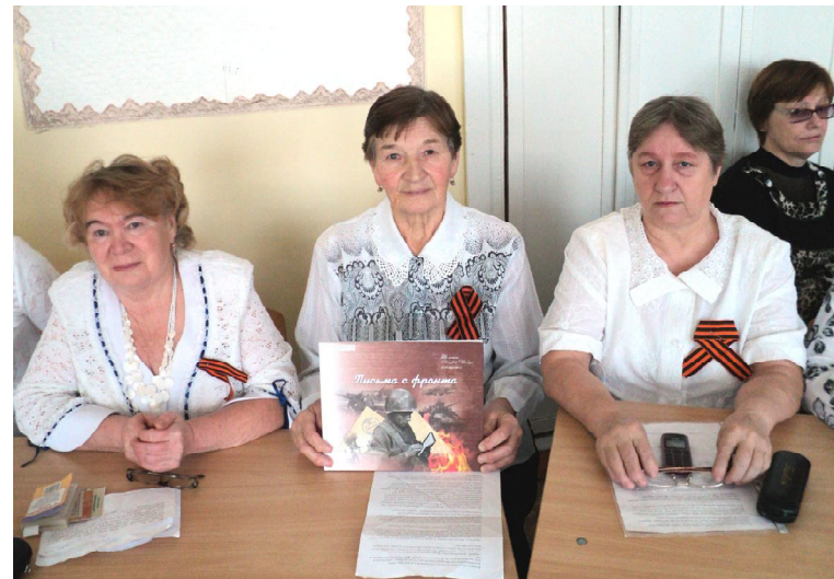
Живая память о войне