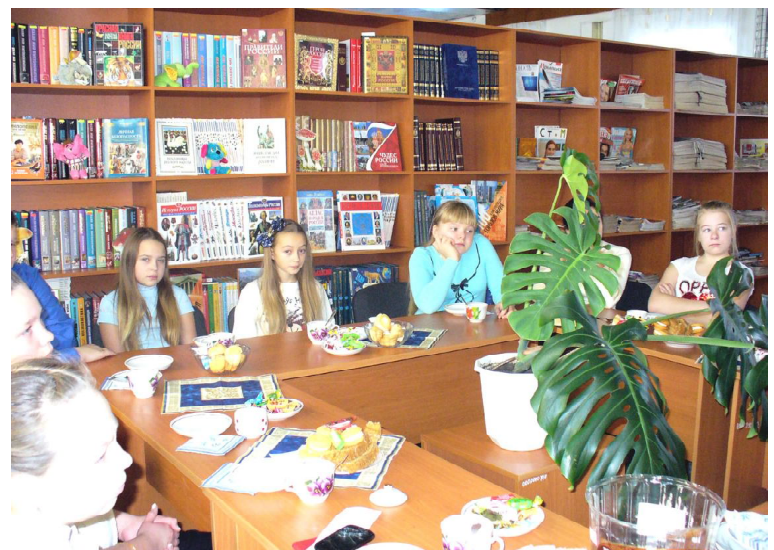
Заседание клуба «Стишарики»