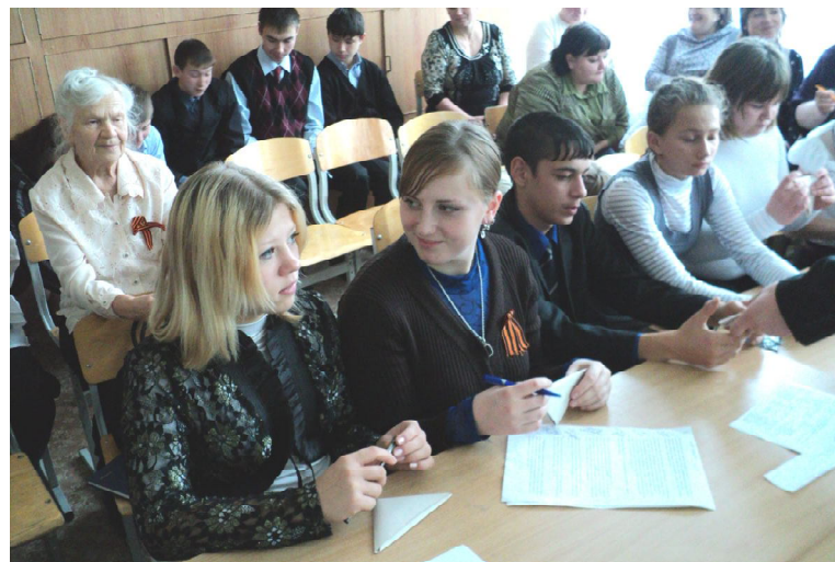
Письма-треугольники пишут ученики Окуневской СОШ