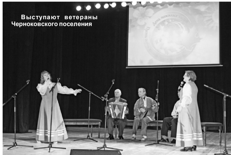
Выступают ветераны Черноковского поселения

коллектив Бегишевского поселения, и победил в этой номинации театр «Арлекино» (п. Заречный).