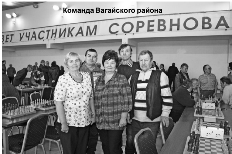
Команда Вагайского района