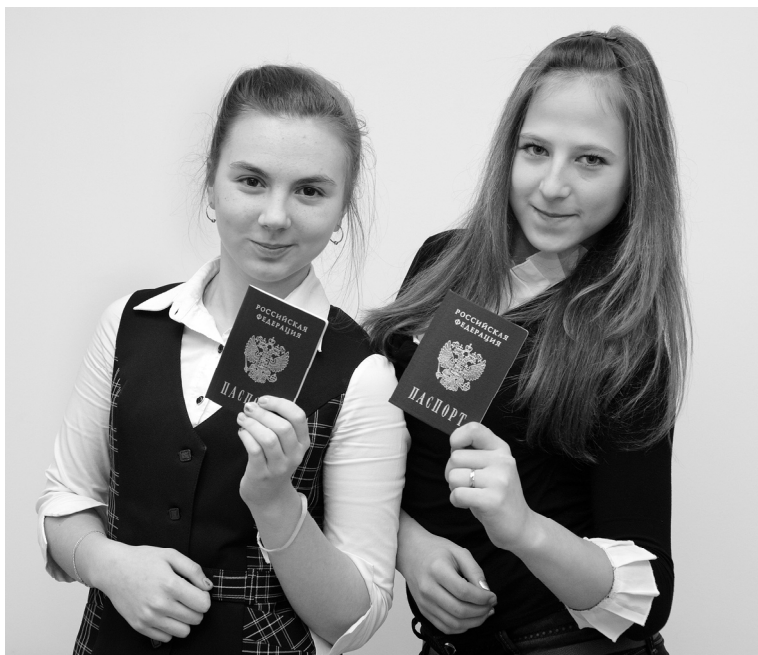
«И вот уже зовут по отчеству...»