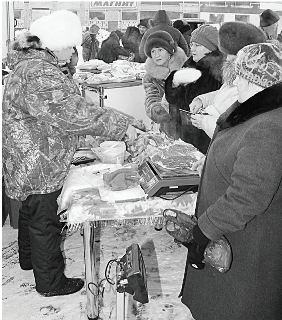
Один рассчитывается, другой приглядывается, третий расспрашивает – это ярмарка!