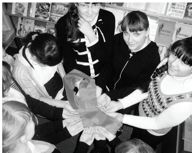
Скажи жизни «Да!», и ты победишь, увидишь в чём радость, дружба и смысл!