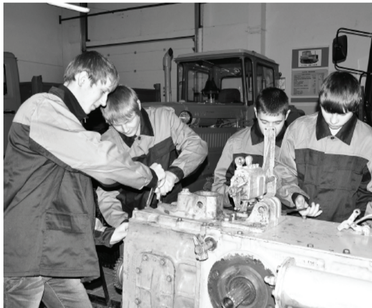
В распоряжении учащихся просторные и светлые лаборатории, где они на практике могут познакомиться с устройством тракторов и автомобилей, их техническим обслуживанием.