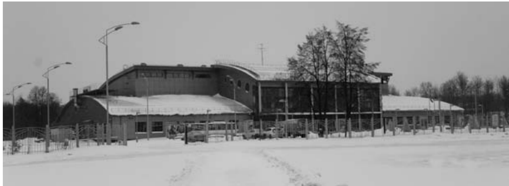
Подготовила Вера ХОХЛОВА